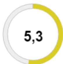
Risco de incumprimento medio